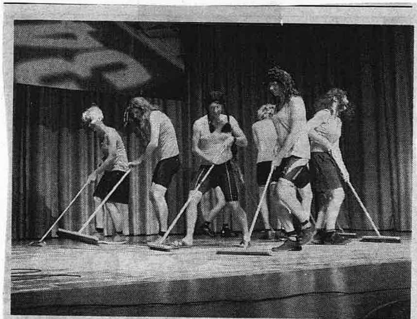
BUTZBACH. In der Abschlussfeier der Schrenzerschule eroberte das Besenballett die Herzen des Publikums im Sturm.