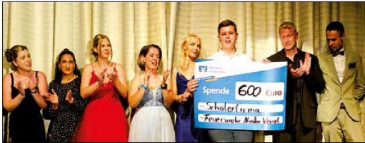
BUTZBACH. Die Freiwillige Feuerwehr Nieder-Weisel freute sich riesig über die Geldspende der Schülerfirma der Schrenzerschule.

Musikalische und tänzerische Glanzlichter in der Abschlussfeier der Schrenzerschule Butzbach