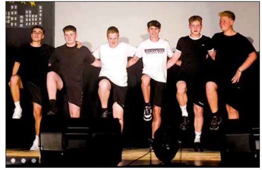
BUTZBACH. Auch Männer beherrschen den Can Can vortrefflich, wie die Schüler in der Abschlussfeier der Schrenzerschule bewiesen.