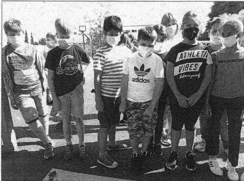
BUTZBACH. Schüler schnuppern auf dem „Marktplatz der Ideen“ in das vielfältige AG-Angebot der Schrenzerschule.